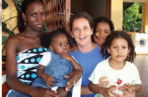
"Kvsem hocemo iti s poniznim srcem, pripravljene sprejemati v enaki meri kot dajati." (iz Konstitucij Fmm)

Seveda! V Ameriki so laična gibanja, ki živijo duhovnost določene kongregacije, zelo razširjena. Sama sem spremljala skupino žena in mož, ki so živeli duhovnost frančiškank Marijinih misijonark. Prej sem mislila, da moraš postati sestra, da lahko živiš našo karizmo. Sploh ne! Ob njih sem odkrila, da je karizma toliko živa, kolikor jo živimo! Zanimivo, kajne?