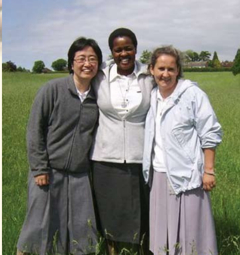
"Različnost sester krepi naso edinost." (iz Konstitucij Fmm)

Vzgojena sem bila v globoko verni družini. Bila sem članica poljskega gibanja za mlade Vera in življenje. Tam sem začela moliti ob Božji besedi in se naučila ubesediti svojo izkušnjo vere.