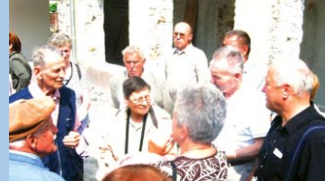
obisk pri sv. Ani v Kopru

Spoštovani, potrebno se je velikokrat sprehoditi skozi besede, ki so zapisane po navdih-njenju in so svete, ker so božje. Ob dvanajsti