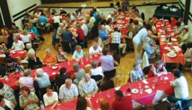
V rdeči dvorani

Cenjeni zbor, sedaj je tudi prilika, da bi vam govoril o statistikah, številkah in doživetjih skozi naših dvanajst let. Seveda bi lahko. Ali pa je to sploh potrebno? Vsakoletne bilance ne morejo brez števil. V tem trenutku se mi ne zdijo pomembne v takšnem tonu, kot se nam dogaja to slavje. Lahko bi bile celo odveč. Ne moremo pa mimo brez onih drugačnih števil, ki niso izražene v številkah, ampak v dogodkih, v doživetjih in veselju vsakogar od nas, ko nam je dano doživeti različne svete kraje, njihovo poučno vsebino in prijateljsko družjenje in srečevanje. Ta pa so v vas zapisana in to je dovolj.