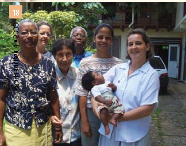
Laiki, ki v Gvajani živijo duhovnost sester Fmm

Pogovarjala se je s. Ana Slivka FMM