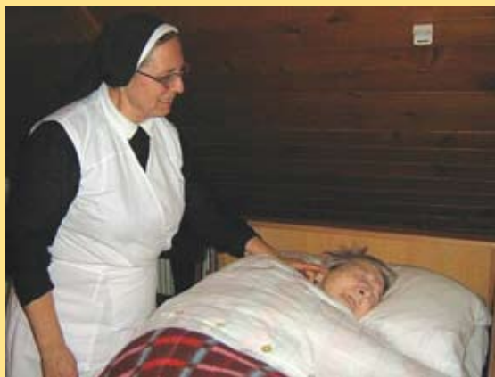
Skrb za ostarele

Moj poklic je najprej biti šolska sestra, redovnica. In to me najbolj veseli, ker se vedno bolj zavedam, da sem prejela velik dar redovništva, ki ga želim živeti s sestrami in ga deliti tudi z drugimi.