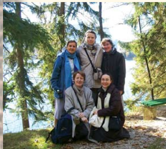
Na sprehodu okrog Blejskega jezera