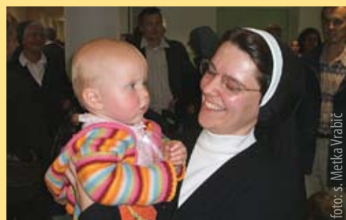
Vzgojiteljice v vrtcih

Šolske, ker so naše prve sestre začele v Mariboru s poukom in varstvom otrok ter učiteljiščem. Danes je naša karizma vzgoja v širšem pomenu: najmlajšim, odraslim in tudi starejšim pomagati v celostni rasti osebnosti.